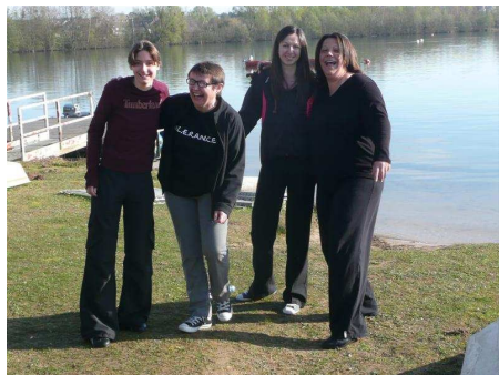
Les « Girls » du N1

Tout cela s'est bien sûr terminé autour d'un apéro et d'un pique nique. Prochaine séance le 26 avril, venez nombreux.