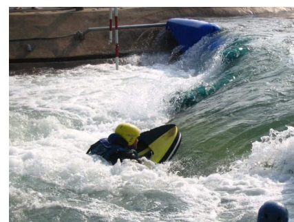
Alors, coincé dans le creux ?