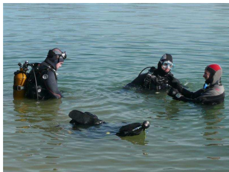
La mise à l'eau