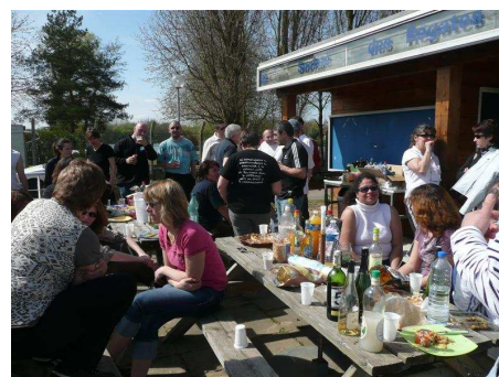
Ahhh, l'apéro et le repas