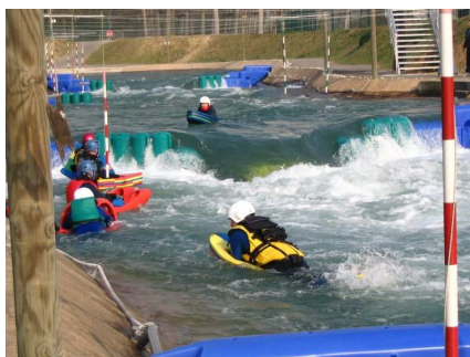
Bien à l'abri derrière les plots