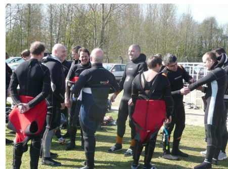
Papotage et entre aide