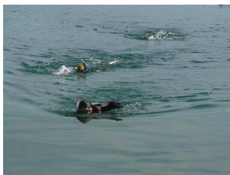
Le 500m PMT pour les N2