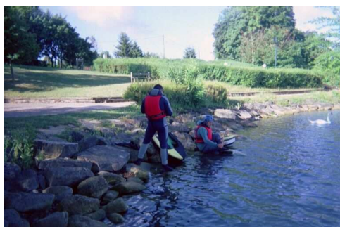
La mise à l'eau

Le nombre de places étant limité, pour l'année prochaine, pensez à vous inscrire dès que les dates seront mises sur le site Web du club (rubrique « Activités »).