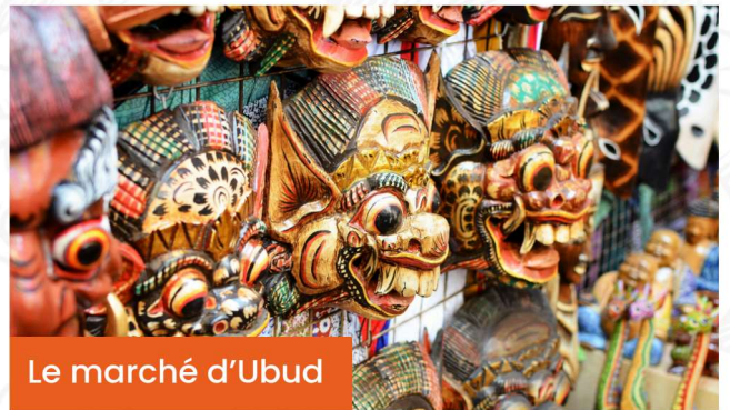
Le marché d'Ubud